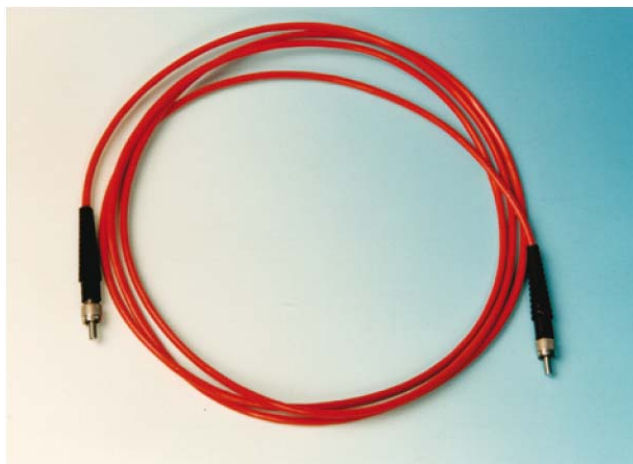
Obr. 1: Světlovodné vlákno

Poté si načteme data ze souboru, který je dodán ke kalibrační lampě. Tyto si zobrazíme jako křivku v režimu pro měření spektra světelných zdrojů. V dalším kroku si připojíme kalibrační lampu pomocí světlovodného vlákna ke spektrometru a zobrazíme křivku, u které vhodně zvolíme integrační čas, tak aby byla křivka rovnoměrně rozprostřena přes celý měřicí rozsah. Pokud nám zobrazení spektra vyhovuje, tak si změřená data uložíme a zobrazíme si je v grafu, společně se spektrem kalibrační lampy. Změřená data lze poté exportovat do prostředí MS Excel a dále s nimi pracovat a porovnat výchozí spektrum kalibrační lampy se spektrem po průchodu světlovodným vláknem.